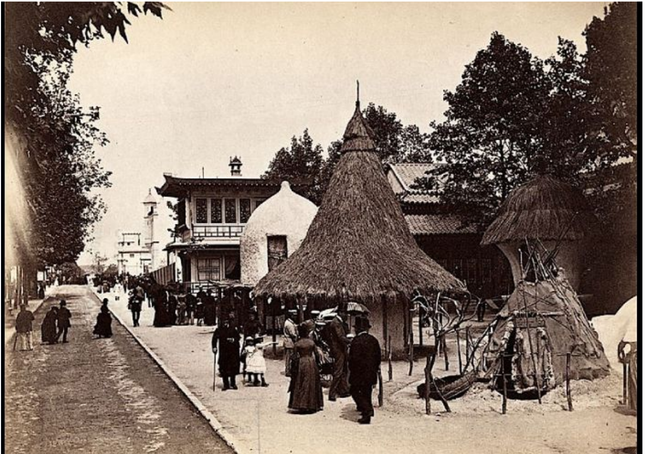
, Somu paviljons:

1889.gadā notika Pasaules izstāde Parīzē. (pirmā notika 1878.g.) Šim pasākumam par godu tika uzbūvēti daudzi arhitektūras objekti, to skaitā arī slavenais Eifeļa tornis. Izstādē bija dažādi paviljoni. Daudz ar tehnoloģijām saistīti. Arī Francijas koloniju zemju kultūra tika pārstāvēta bagātīgi. Piem. Nēģēru paviljons - Village nègre :