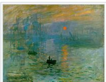
Vārds "Impresionisms" cēlies no Kloda Monē gleznas Impresija . Saullēkts nosaukuma

Arī paša virziena nosaukums cēlies no kritiska raksta ar virsrakstu Impresionistu izstāde , kurš tā nosaukts, apspēlējot Kloda Monē gleznas Impresija . Saullēkts nosaukumu.